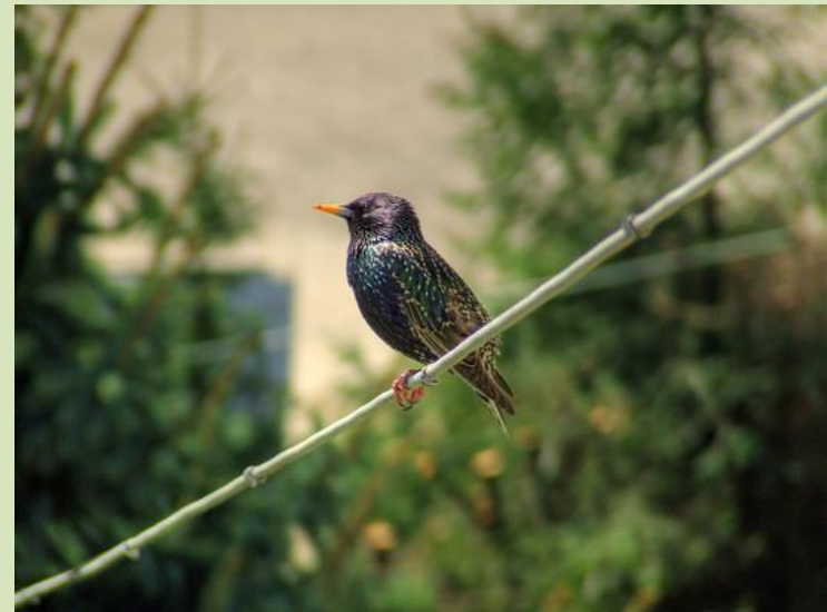
Szpak zwyczajny, szpak pospolity Podlega ochronie gatunkowej.