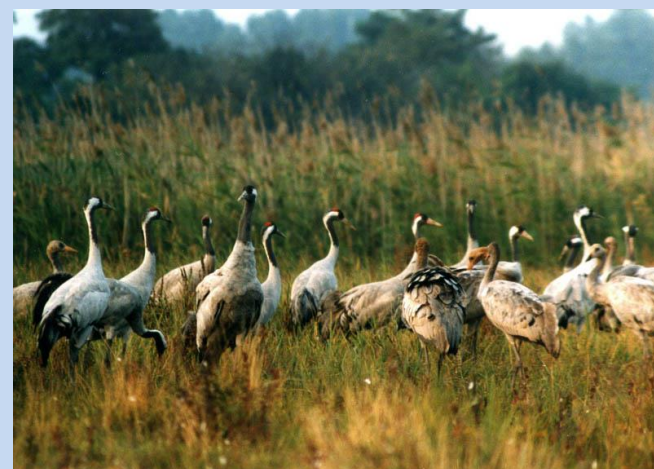
ŻURAWIE - Wiosenne powroty w marcu i kwietniu, a jesienne przeloty we wrześniu i październiku.